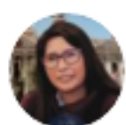
Eva Copa @EvaCopa_Bol

Presidenta de La Asamblea Legislativa Plurinacional de Bolivia