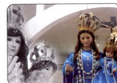
Virgen del Rosario