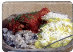
Picante de Pollo