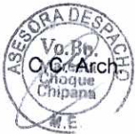
Adrián Rubén Quelca Targui MINISTRO DE EDUCACIÓN ESTADO PLURINACIONAL DE BOLIVIA

Se hace propicia la ocasión, para reiterar a usted, las consideraciones más distinguidas.